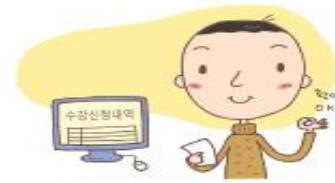
④ 수강신청 확인