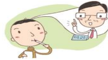
② 수강신청 권장 과목 및 학점에 따라 신청 과목 선택 (학과 사무실에 수강과목에 대한 문의 가능)