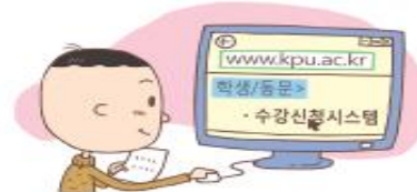
③ 수강신청(인터넷 접속, 신청)