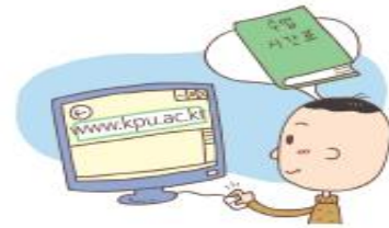
① 「신입생 학사안내」책자 숙지

※ 선택과목도 학과별 졸업기준 충족을 위해 정해진 학점 이상으로 수강이 필요합니다. 특히 교양선택 과목 중 "핵심교양" 과목은 영역별로 1과목씩 이수해야 졸업이 가능합니다.